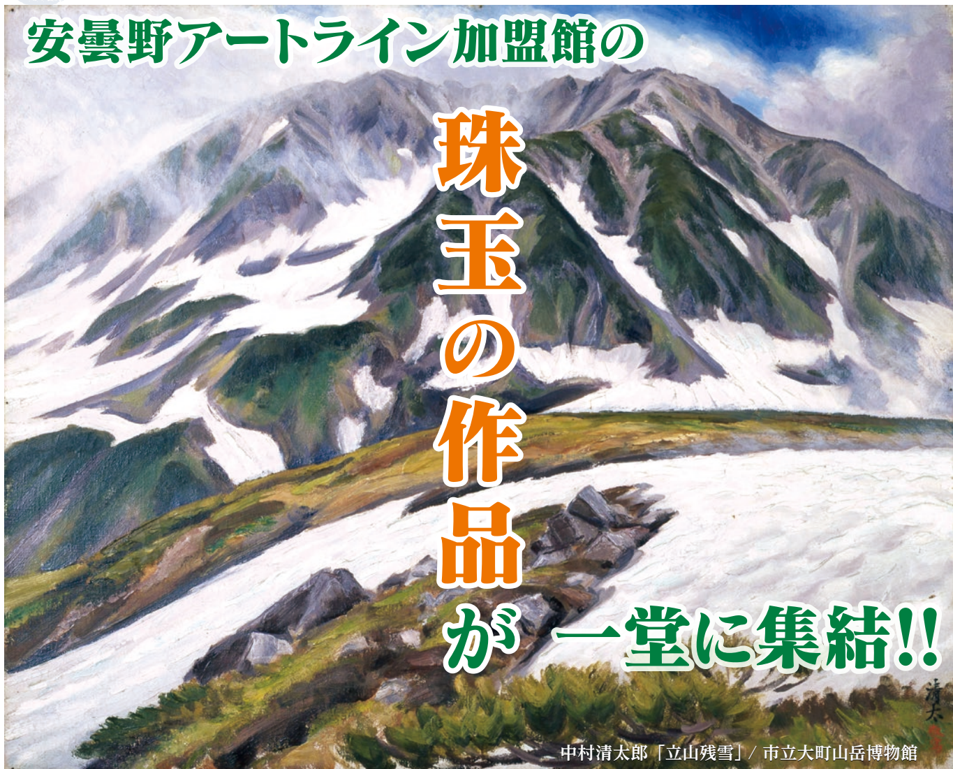
中村清太郎「立山残雪」/ 市立大町山岳博物館

会期：令和5年10月7日(土)～10月22日(日) (10月10日(月)、10月16日(日)は休館)